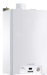
MCX 24 PLUS MCX 24/28 MI PLUS