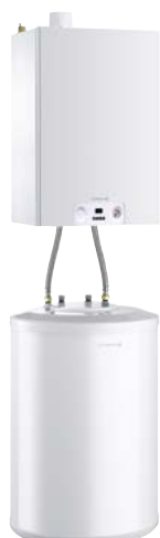
MCX 24 PLUS z podgrzewaczem 120 l lub 150 l